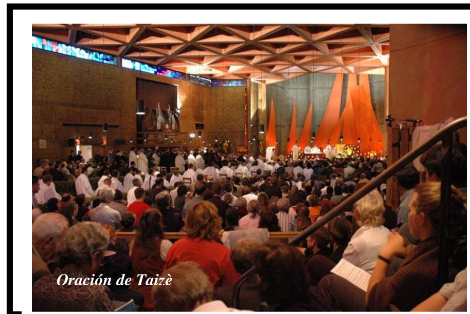
Oración de Taizé